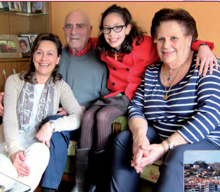
Padres, hermana y sobrina del Rector Mayor.