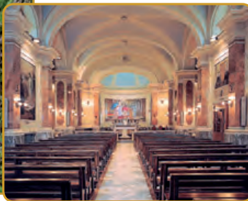
Fotografía del interior de la iglesia de San Francisco de Sales, la iglesia del Oratorio, en la actualidad.

Nota. Año 1851. El cobertizo Pinardi ha quedado pequeño para tantos muchachos. Don Bosco bendice la primera piedra de la Iglesia de San Francisco de Sales; la iglesia del Oratorio. Actualmente se conserva en uso tal como la construyera Don Bosco. ( Memorias del Oratorio. Década tercera, n° 16 ).