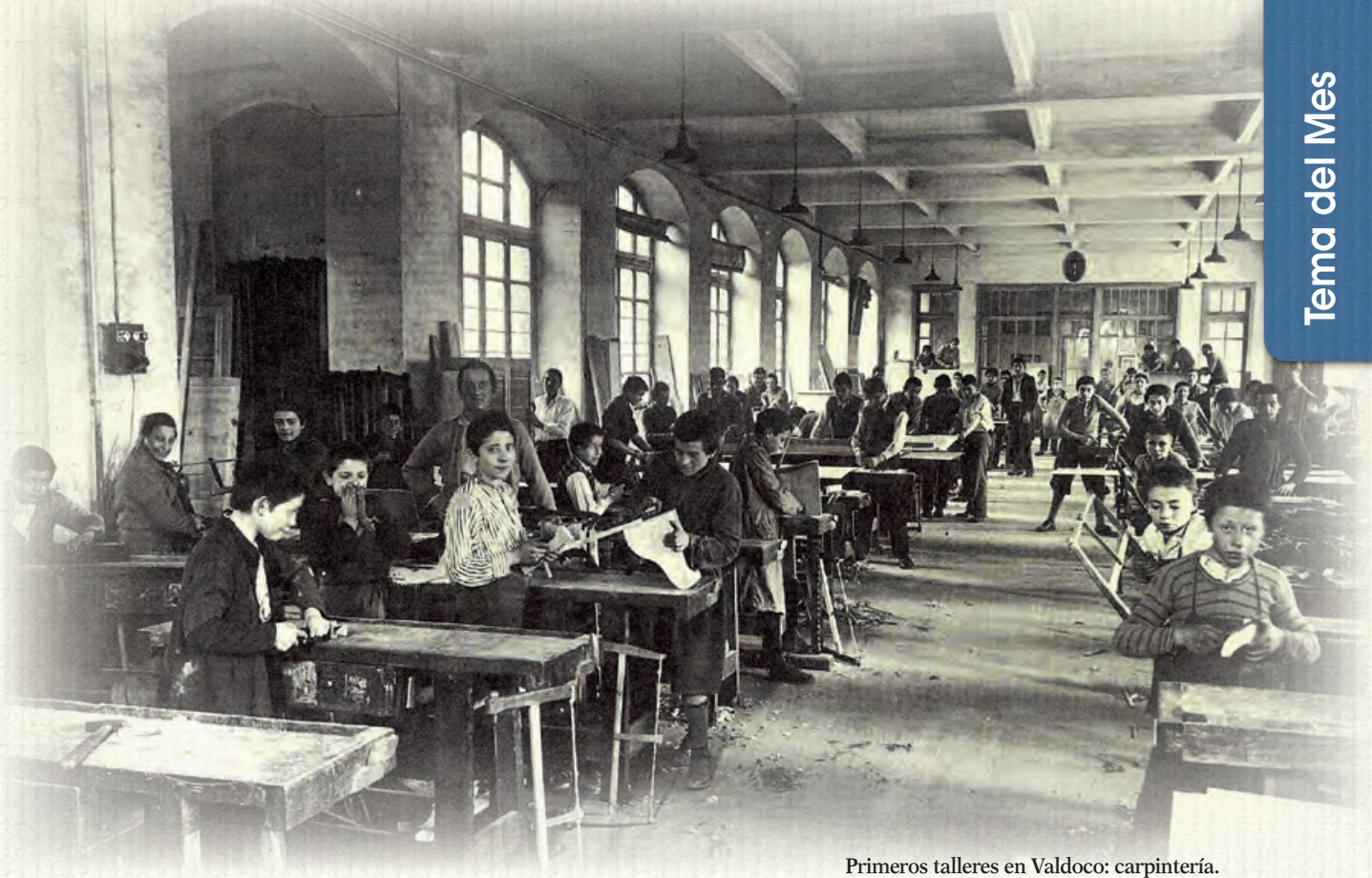
Primeros talleres en Valdoco: carpintería.