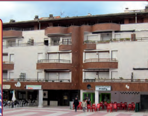
Casa actual de sus padres en Luanco (Asturias).