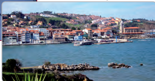
Luanco (Asturias), pueblo natal.

P: De las comidas que tú le haces regularmente cuando va a Luanco, ¿cuáles son sus preferidas?