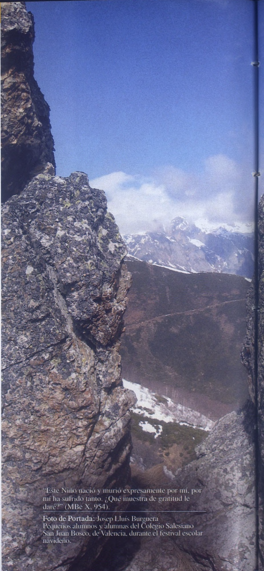
Pequeños alumnos y alumnas del Colegio Salesiano San Juan Bosco, de Valencia, durante el festival escolar navideno.

"Este Niño nació y murió expresamente por mí, por mí ha sufrido tanto. ¿Qué muestra de gratitud le daré?" (MBe X, 954).