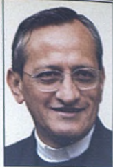
Don Pascual Chávez Rector Mayor